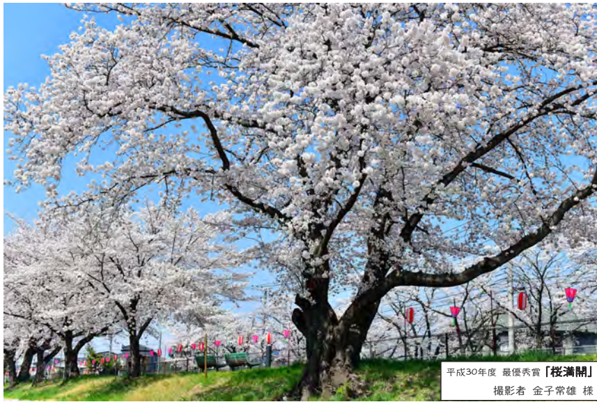
平成30年度 最優秀賞「桜満開」